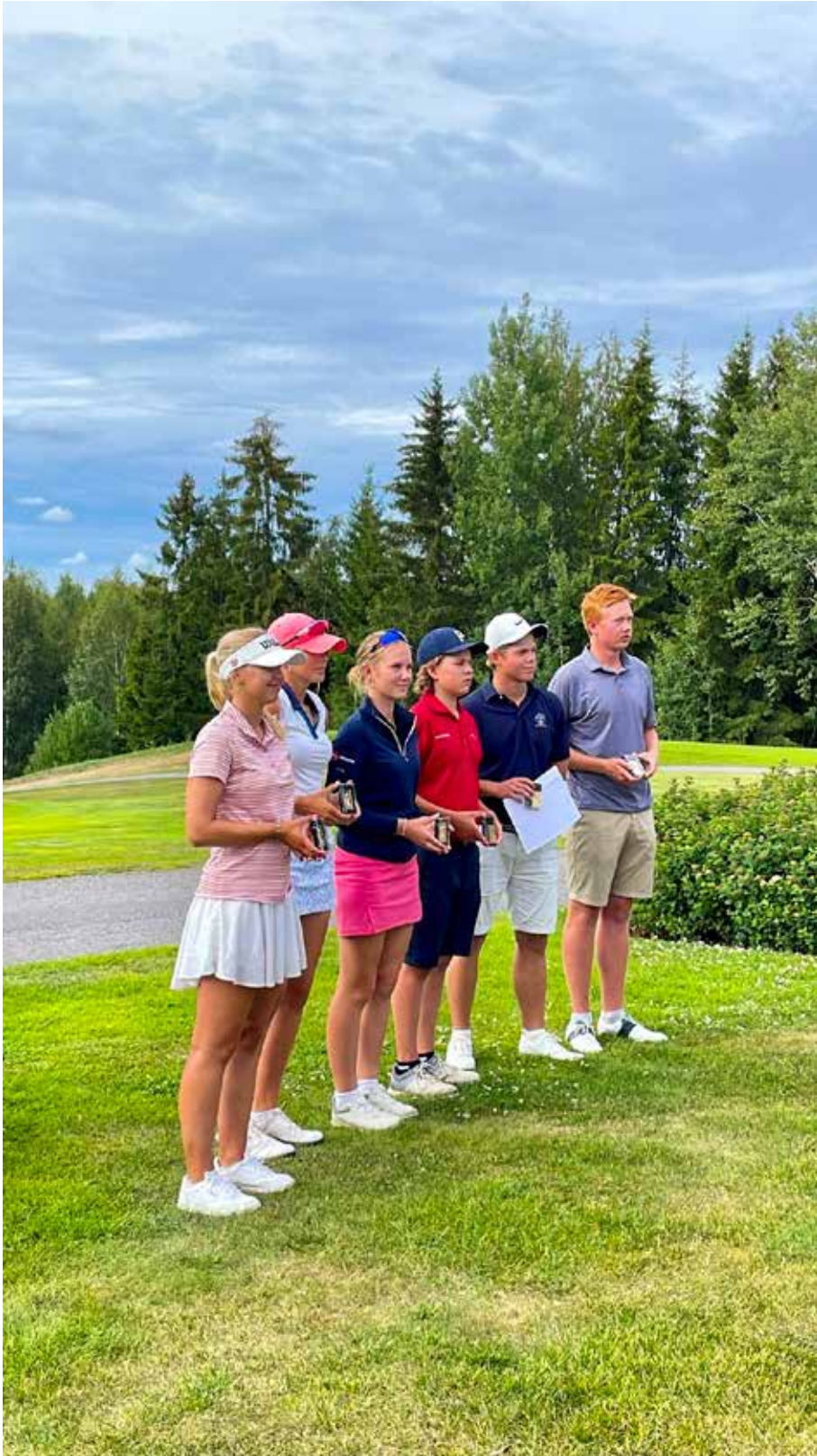
Reikäpeli SM-kisojen sarjojen parhaat