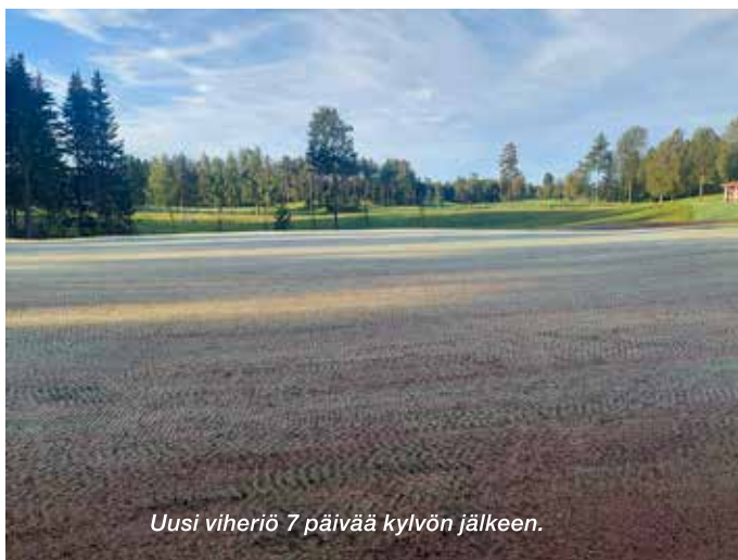
Uusi viheriö 7 päivää kylvön jälkeen.

Kovalla työllä ja ajan kanssa kenttä saatiin suht hyvään kuntoon juhannuksen jälkeisellä viikolla, pois lukien A1-viheriö, jonka iso ongelma on varjoisuus. Naapuri on onneksemme tilannut hakkuun tontilleen ja suurin osa viheriötä varjostavasta puustosta häviää talven aikana.