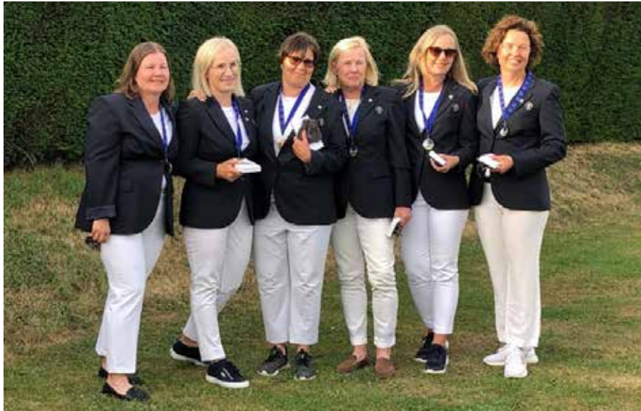
Suomen naisten maajoukkue N50-sarjassa saavutti EM-hopeaa Marisa Sgaravatti Trophyssa.