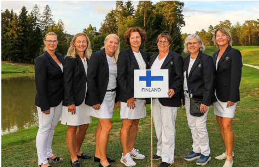
Naisten EM-kisajoukkue syyskuussa Cubo Golfissa Sloveniassa.