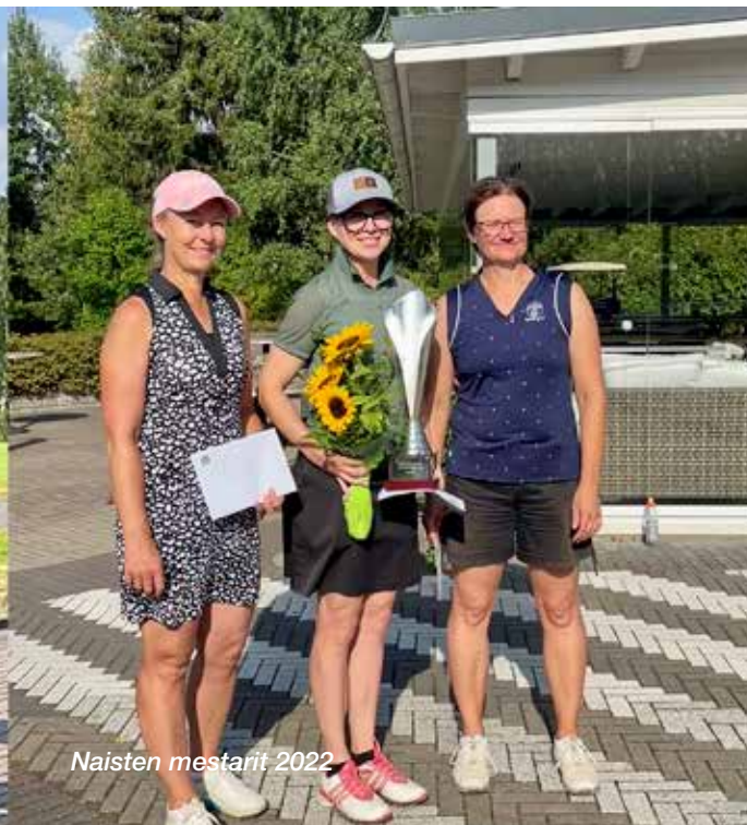
Naisten mestarit 2022