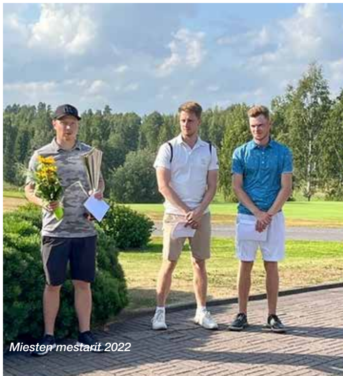
Miesten mestarit 2022