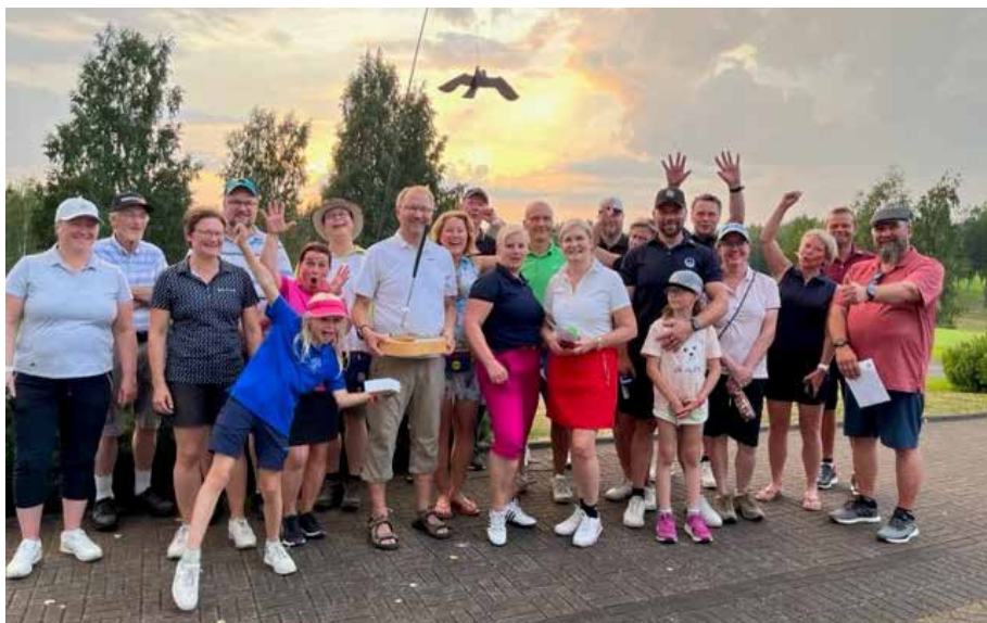
Leikkimielistä Kapteenin Kannu -kisaa pelattiin perjantaina 19.8.