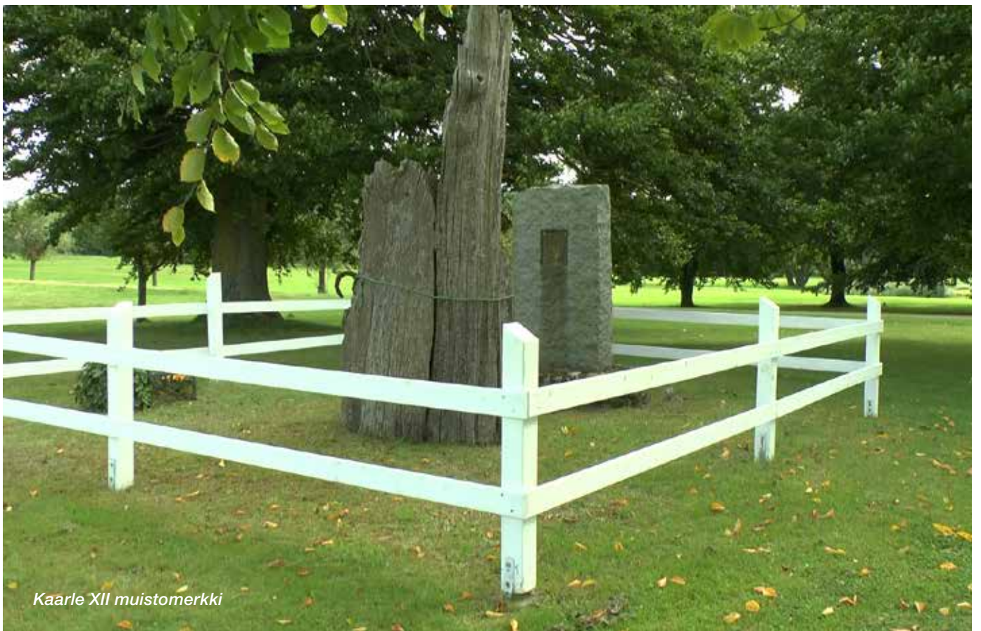
Kaarle XII muistomerkki