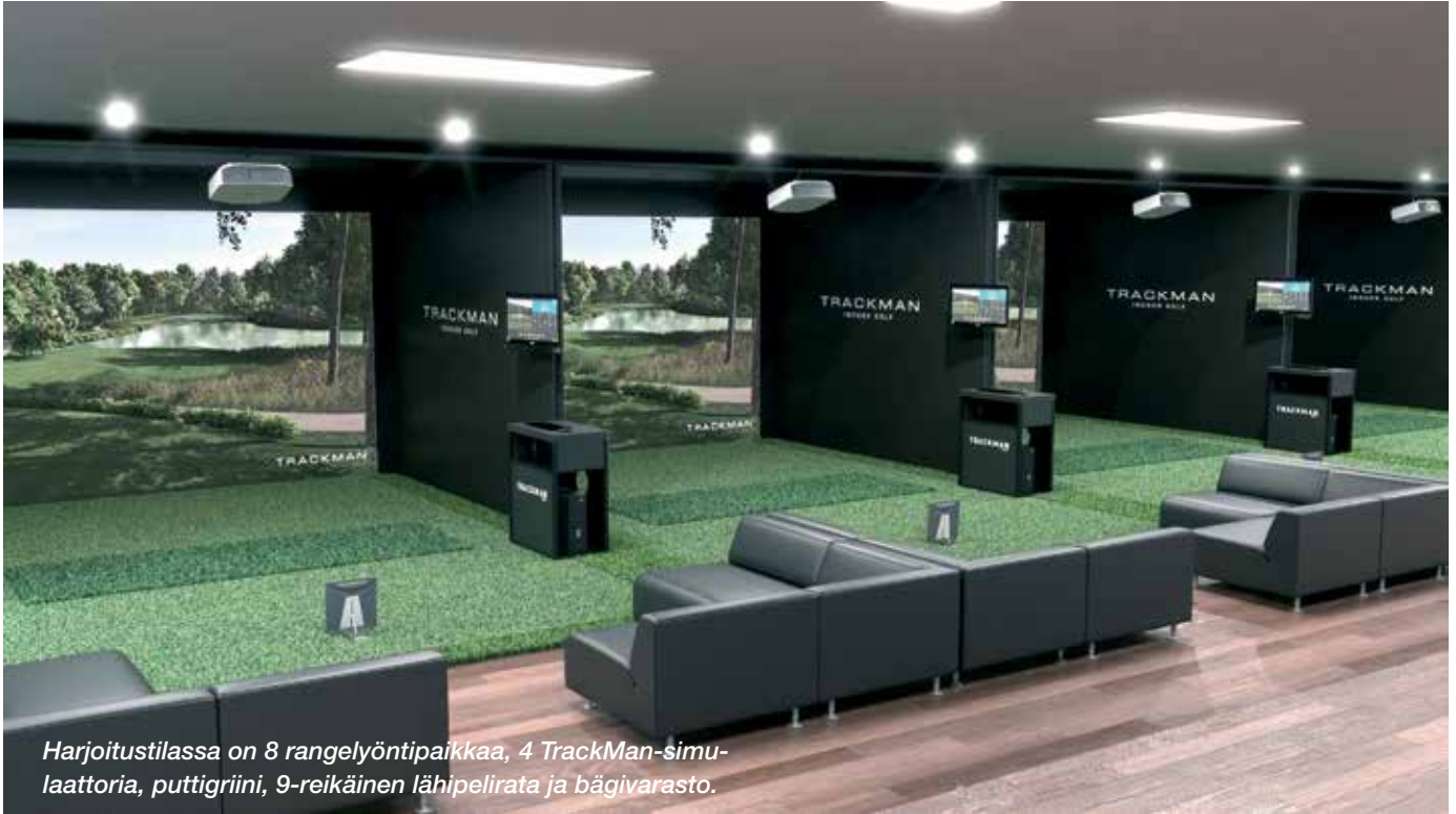
Harjoitustilassa on 8 rangelyöntipaikkaa, 4 TrackMan-simulaattoria, puttigriini, 9-reikäinen lähipelirata ja bägivarasto.