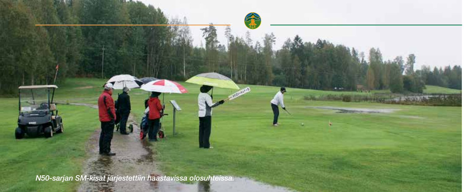
N50-sarjan SM-kisat järjestettiin haastavissa olosuhteissa.